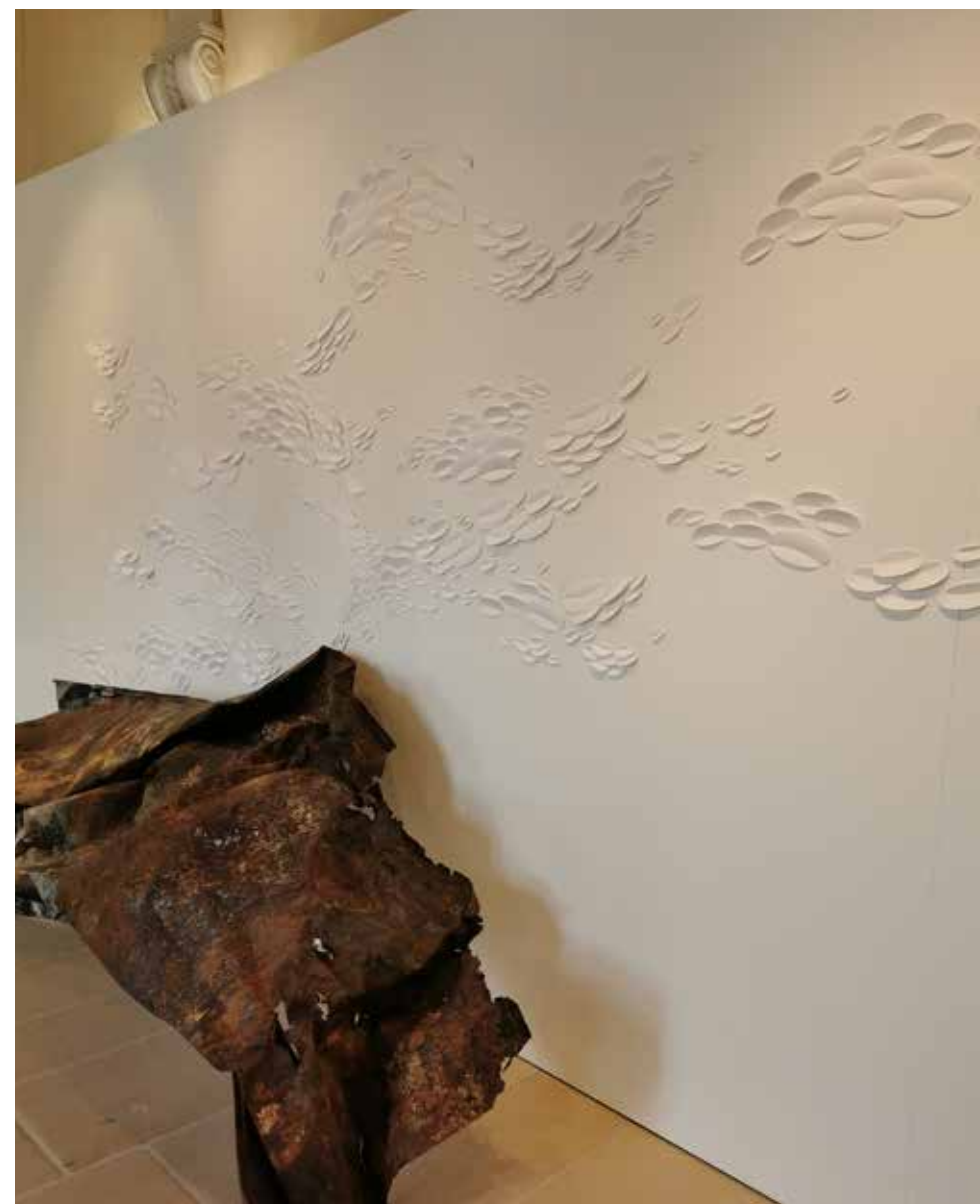
Ci-dessus : Janique BOURGET, Refaire surface, tôle d'acier rouillée, papier, colle, 2021. L'installation de papier a été réalisée lors d'une performance par l'artiste face au public le 19 et 20 juin 2021.

Kircheim et Lochwiler sont deux villages situés en Alsace. Des glissements de terrain et des infiltrations d'eau y ont eu lieu, suite à un forage de géothermie. Une prise d'empreinte a été réalisée sur place, et se retrouve à la crête de ces sculptures murales. La cassure centrale évoque cette percée dans les profondeurs, rupture dans le sous-sol.