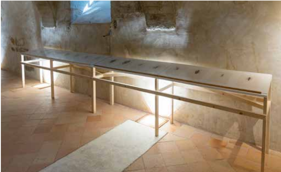
Pages précédentes : Mathilde Caylou, Plessage , verre filé, photographie numérique rétroéclairée, 270x135x50cm, 2020