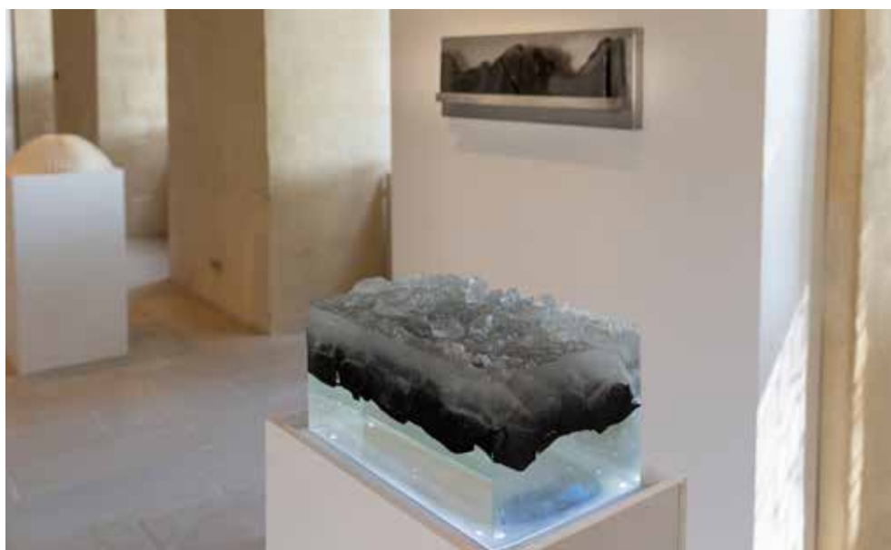
Ci-dessus haut : Mathilde Caylou, Kircheim, casting, verre moulé et poli, socle mural en aluminium, 84x29x13cm, 2016