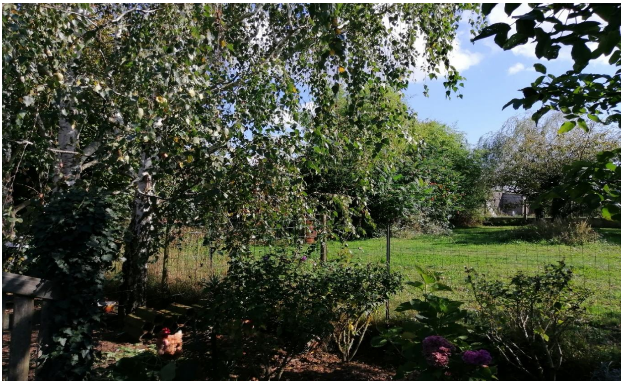
Fond de parcelle n°189, vers le Nord