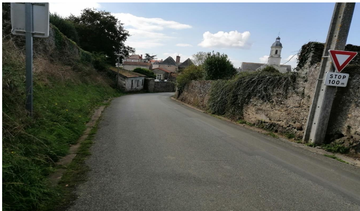
Rue de la Chapelle au niveau de la parcelle 174 : mur à droite.