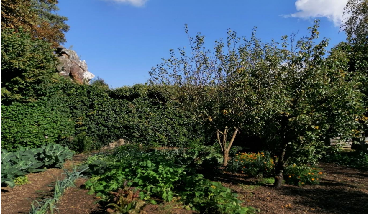
Fond de parcelle n°193, vers l'Est ; derrière la haie on aperçoit à gauche le calvaire accessible par la partie Est de l'OAP